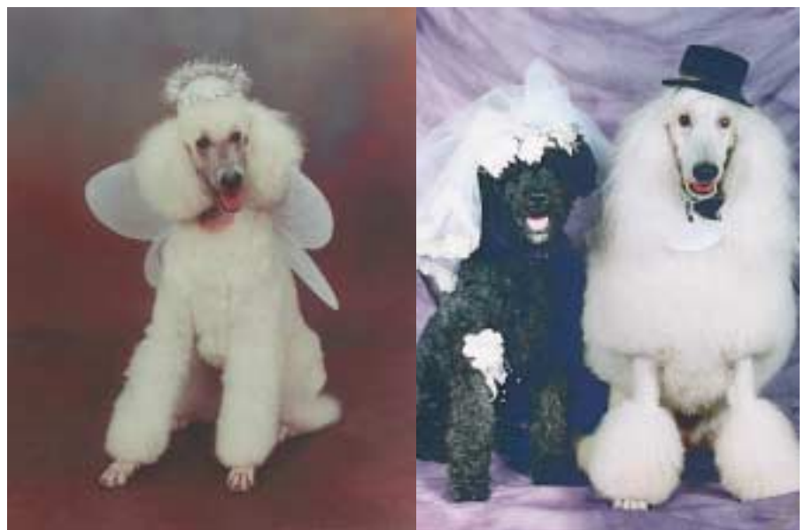
Lustig oder entwürdigend?